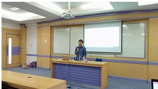
Gambar 4. Penyampaian Materi

Setelah dilakukan pemaparan materi dilakukan sesi tanya jawab yang pertama dari pukul 11.30 wib sampai dengan pukul 12.00 wib. Pada sesi ini peserta antusias mengajukan pertanyaan, namun karena waktu yang terbatas sehingga 3 pertanyaan dari peserta yang bisa diajukan. Acara dilanjutkan dengan ishomea mulai Pukul 12.00 wib sampai pukul 13.00 wib.