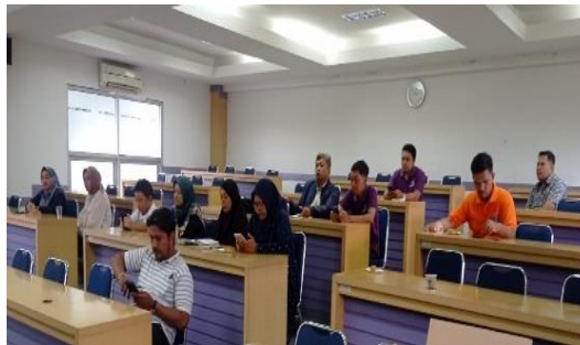
Gambar 5. Peserta Pelatihan

Pukul 15.00 wib peserta dipersilahkan untuk melakukan isoma sampai pukul 15,30 wib, Setelah isoma dilanjutkan dengan membahas metode penelitian. Penulisan metode penelitian sebaiknya ditulis menggunakan kalimat pasif dan ringkas yang mudah dipahami oleh pembaca agar pembaca dapat mengikuti atau mengulang penelitian tersebut. Jika terdapat uji statistik maka dijelaskan uji yang dilakukan serta software yang digunakan.