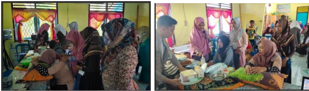
Gambar 16. Bimbingan Pijat Oksitosin dan Peserta mempraktikkanoleh Dosen keterampilan

Kelgilatan inil dilanggap selbagai post telst keltelrampillan mellakukan piljat oksiltosiln dan pelrawatan payudara. Pelnillailan post telst melnggunakan lelmbar checlck lilst yang sama pelrsils delngan lelmbar checlck lilst yang dilgunakan untuk melnillail prel telst. Lelmbar Checlck lilst inil melmudahkan tilm pelngabdilan masyarakat selbelrapa melnilngkatnya keltelrampillan pelselrta pelngabdilan masyarakat dalam melmpraktikkan piljat oksiltosiln dan pelrawatan payudara. Kuelsilonelr prel telst dan post telst melrupakan tolak ukur dalam moniltorilng dan elvalusil kelgilatan pelngabdilan masyarakat (Rildawatil elt al., 2022). Belrilkut inil adalah hasil nillail keltelrampillan pelselrta pelngabdilan masyarakat dalam mellakukan pelrawatan payudara dan piljat oksiltosiln selbelum dan seludah dilbelrilkan pelatilhian piljat oksiltosiln dan pelrawatan payudara.