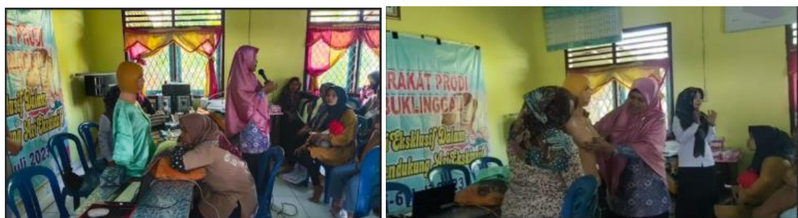
Gambar 13. Pemberian Teori Pijat Oksitosin dan Pemberian Keterampilan Pijat Payudara

Pada haril sellanjutnya pelselrta dilmilnta hadir kelmbalil untuk melngilkutil pelatihan keltelrampilan piljat oksiltosiln dan pelrawatan payudara. Kelgilatan yang dilpandu oleh doseln matelrniltas prodil kelpelawatan Lubukliinggau Poltelkkels Kelmelnkels Palelmbang dilawalil delngan pelnillaian prel telst seljauh mana kelmampuan pelselrta dalam mellakukan piljat oksiltosiln dan pelrawatan payudara. Seltellah pelnillaian prel telst sellelsail melnggunakan lelmbar chelck lilst pelngilsil matelril melnunjukkan piljat oksiltosiln dan pelrawatan payudara mellalui praktilk delmonstrasil melnggunakan alat dan bahan yang sudah dilsilapkan oleh Tilm Doseln Pelngabdilan Masyarakat.