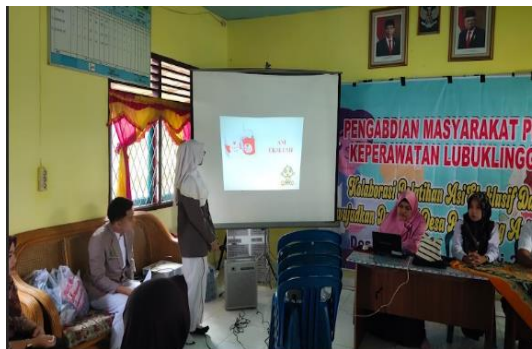
Gambar 4. Penjelasan ASI Eksklusif oleh dan Pemberian Materi oleh Bidan Desa Mahasiswa

Tahap selanjutnya adalah penyuluhan ASII Eksklusif yang dilakukan secara berurutan oleh mahasiswa Prodi Kelperawatan Lubuklinggau, bidan desa dan perangkat Desa. Penyuluhan dilakukan secara panel dan peserta dipersilahkan bertanya di sela-sela penyuluhan. Peserta yang bertanya dan mampu menjawab pertanyaan diberikan doorprize oleh pelaksana pengabdian masyarakat. Peserta terlihat antusias dalam menyimak dan melakukan tanya jawab seputar ASII Eksklusif. Banyak dari peserta yang pada awalnya tidak memahami bahwa ASII Eksklusif adalah ASII saja yang diberikan kepada bayi tanpa tambahan apa pun bahkan air putih. Setelah kegiatan penyuluhan selesai dilaksanakan peserta pengabdian masyarakat mengisi lembar kuisioner pengetahuan (Post Test).