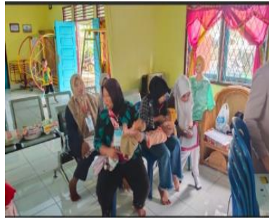
Gambar 2. Peserta berkumpul di Aula Balai