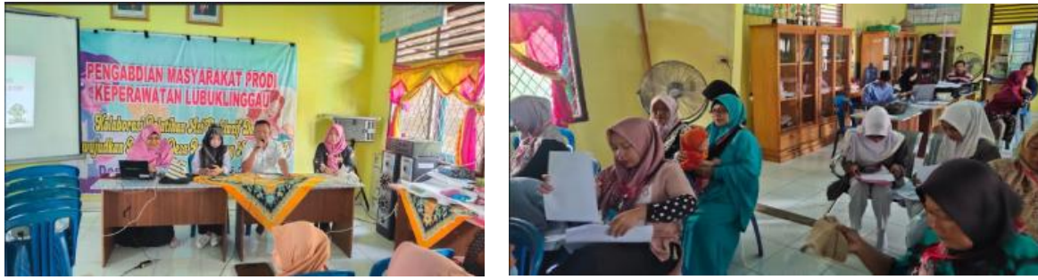
Gambar 6. Pemberian Materi oleh dan Pengisian Post Test oleh Peserta Perangkat Desa

Belrikut ilnil adalah hasilil tilngkat pelngeltahuan pelselrta pelngabdilan masyarakat selbellum dan sesudah dilbelrilkan matelril pelnyuluhan ASII Elksklusif.