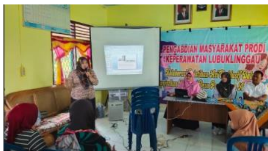
Gambar 5. Pemberian Materi oleh Dosen