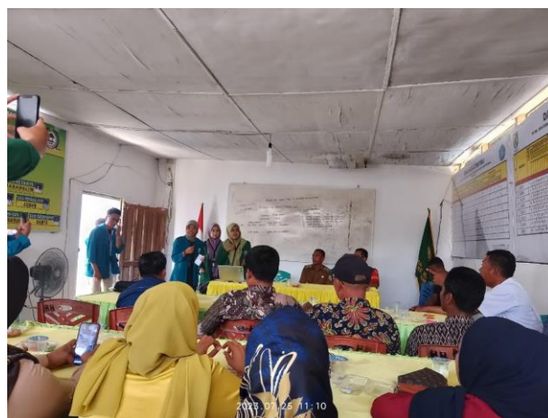
Gambar 2. Kegiatan Sosialisasi

Kegiatan ini diawali dengan meminta izin pada kepada Desa Bogak Besar untuk melakukan sosialisasi pada masyarakat Desa Bogak Besar, Kecamatan Teluk Mengkudu, Kabupaten Serdang Bedagai, Provinsi Sumatera Utara. Kegiatan sosialisasi dilakukan di kantor Desa Bogak Besar. Sosialisasi dilakukan agar masyarakat dapat memiliki pengetahuan dan pemahaman tentang pemanfaatan lahan kosong dan juga mengenai TOGA.