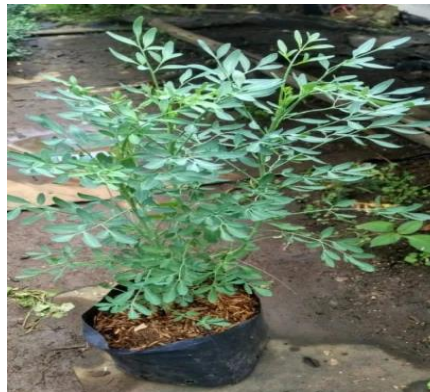
Gambar 4. Jenis Tanaman TOGA yang Digunakan

Setelah tempat untuk menanam TOGA selesai disiapkan, langkah selanjutnya yang dilakukan, yaitu menyiapkan beberapa jenis tanaman TOGA. Adapun tanaman yang disiapkan, yaitu Jahe ( Zingiber officinale ), Kencur ( Kaempferia galangal ), Bunga Telang ( Clitoria ternatea ), Sirih ( Piper betle ), Sirih Merah ( Piper ornatum ), Inggu ( Ruta graveolens ), Kayu Putih ( Melaleuca leucadendra ), Mahkota Dewa ( Phaleria macrocarpa ), dan Daun Kelor ( Moringa oleifera ).