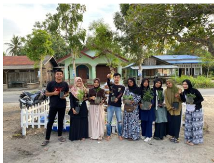
Gambar 5. Dokumentasi Menanam Tanaman TOGA di Desa Bogak Besar

Langkah terakhir yang dilakukan dari pengabdian ini, yaitu mendampingi warga desa Bogak Besar melakukan penanaman tanaman TOGA dan juga melakukan dokumentasi.