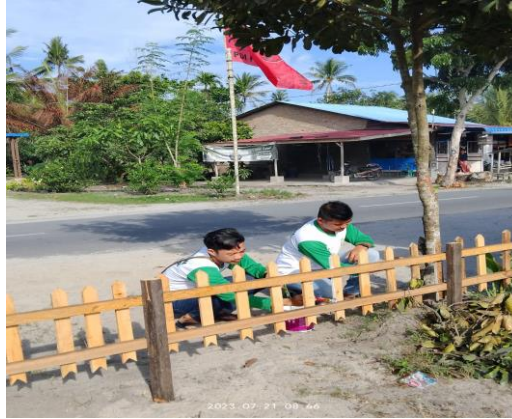
Gambar 3. Kegiatan Pembersihan dan Pembuatan Pagar Tempat Menanam TOGA

Setelah melakukan sosialisasi, selanjutnya meminta izin penggunaan lahan kosong yang akan digunakan sebagai tempat untuk menanam TOGA. Pihak desa Bogak Besar memberikan izin dan memberikan lahan Taman PKK sebagai tempat dilakukannya percontohan untuk menanam TOGA. Setelah mendapatkan izin, langkah selanjutnya yang dilakukan adalah memberishkan lahan dan membuat pagar-pagar pembatas untuk tempat tanaman TOGA akan ditanam.