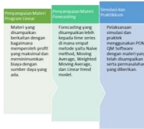
Gambar 1. Prosedur Pelaksanaan Kegiatan Pelatihan

Metode penyampaian materi pelatihan dilakukan dengan Ceramah, tanya jawab serta simulasi. Siswa akan melakukan praktik secara langsung berdasarkan masalah yang diberikan. Proses tanya jawab pun dilakukan dan siswa aktif bertanya kepada pemateri sehingga kegiatan pelatihan ini bersifat interaktif. Evaluasi kegiatan dilakukan selama proses dan akhir pelatihan dengan menggunakan instrumen tes. Evaluasi saat pelaksanaan pelatihan meliputi keterlibatan dan kemampuan peserta setiap tahap pelatihan. Pada tahap akhir diberikan instrumen tes, peserta diharapkan dapat melakukan kegiatan pemecahan masalah yang diberikan yaitu (1) pemahaman materi linear programming dan forecasting; (3) mempraktekan secara langsung dengan membuat model matematika terlebih dahulu untuk fungsi kendala dan fungsi tujuan, menentukan jenis peramalan yang tepat, menginputkan data pada POM-QM, melakukan proses analisis data menggunakan POM-QM, membaca luaran/ouput pada aplikasi POM-QM; (3) mempresentasikan hasil latihan praktikkum dengan permasalahan yang diberikan. Sedangkan, indikator keberhasilan kegiatan pelatihan ini ialah apabila lebih dari 90% peserta memahami materi yang diberikan pada kegiatan pelaksanaan pelatihan, lebih dari 75% peserta mampu mempraktikkan aplikasi POM-QM secara benar dan lebih dari 50% peserta mampu mempresentasikan penggunaan POM-QM materi linear programming dan forecasting dalam bisnis.