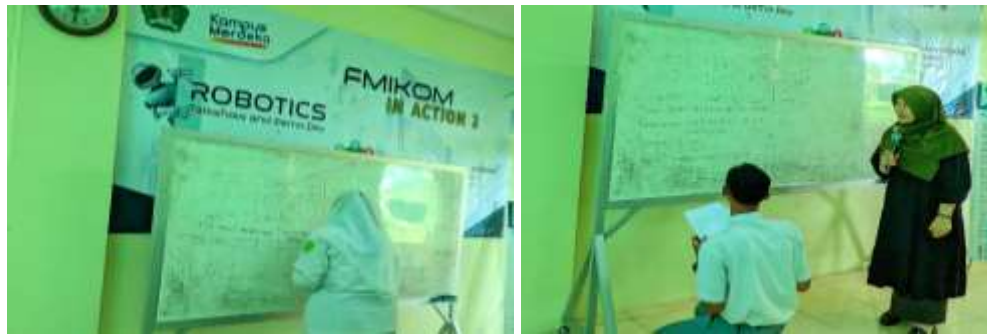
Gambar 3. Dokumentasi Keaktifan Peserta dalam Pelaksanaan

Ketercapaian materi yang disampaikan dalam kegiatan pelatihan ini dapat dilihat dari hasil lembar evaluasi pembelajaran, sebagian besar peserta sudah menguasai materi dengan baik. Berdasarkan pengamatan saat proses pelaksanaan pelatihan dan hasil instrumen yang diberikan diperoleh hasil pada setiap aspeknya masing-masing materi ditunjukkan pada gambar di bawah ini.