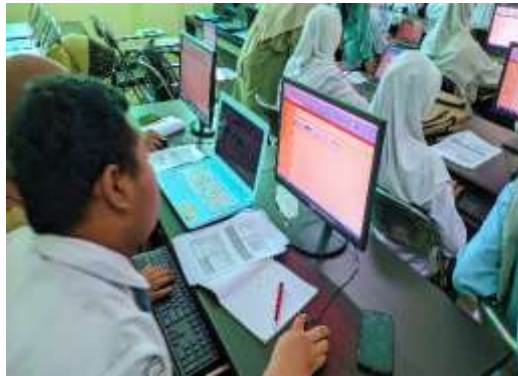
Gambar 2. Dokumentasi Pelaksanaan Praktikkum

Kegiatan dilaksanakan secara bertahap dari pemaparan konsep-konsep program linear ( linear programming ) dengan masalah optimasi maksimum/minimum. Siswa belajar bagaimana memecahkan masalah real dengan memaksimalkan keuntungan dari sumber daya yang ada atau meminimalkan biaya agar tidak ada kerugian. Materi tersebut disampaikan secara runtut dan sistematis dengan mencontohkan permasalahan yang real. Tahapan pemecahan masalah optimasi pada linear programming antara lain: (1) identifikasi variabel; (2) membuat model matematika fungsi kendala dan fungsi tujuan; (3) menginputkan data pada POM-QM; (4) melakukan proses analisis; (5) membaca luaran/output hasil. Siswa mendapatkan materi tersebut secara langsung dengan melakukan praktikkum POM-QM.