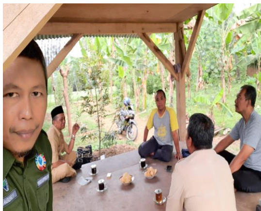
Gambar 1. Koordinasi dengan Kepala desa dan pengurus Bumdes

Langkah awal dalam kegiatan pengabdian masyarakat ini adalah koordinasi dengan pihak kepala Desa dan Pengurus Bumdes. Sebagai pelaksana kegiatan koordinasi dilaksanakan bertujuan untuk memberikan pemahaman bagaimana pentingnya intergrasi antara UMKM dan Bumdes.