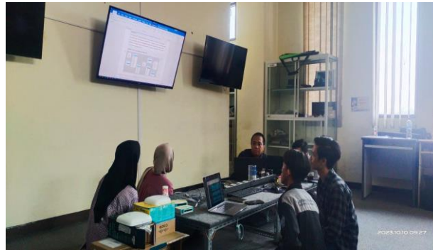
Gambar 2. Koordinasi dengan Dosen dan Tim Mahasiswa

Setelah berkoordinasi dengan Bapak Kepala Desa Sarikemuning dan Pengurus Bumdes selanjutnya ketua tim pelaksana berkoordinasi dengan dosen anggota dan mahasiswa. Untuk menjawab permasalahan mitra dari segi Aplikasi Bumdes Mart yang akan di buat nanti dengan harapan dapat meningkatkan kemampuan Bumdes tersebut dari segi Pemasaran Produk dan dari sisi Manajemen Bumdes nya. Dalam Pembuatan Aplikasi Bumdes ini sebagai ketua pelaksana adalah dosen Prodi Teknik Informatika. Dalam pelaksanaan pengabdian ini ketua dibantu dua dosen dari Prodi Teknik Informatika serta dibantu oleh mahasiswa dengan jurusan Teknik Informatika.