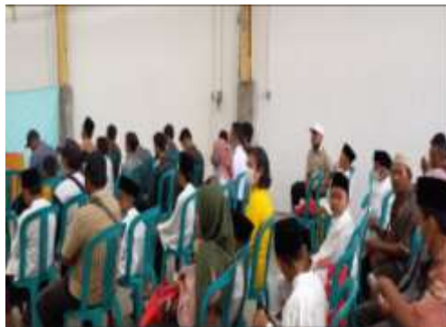
Gambar 1. Peserta sebelum Penyampaian informasi dan Peserta saat Penyampaian informasi

Hal ini sesuai dengan penelitian Arifah (2013) yang menyampaikan bahwa pemberian informasi yang benar dan tepat dapat menurunkan tingkat kecemasan pasien secara signifikan. Demikian juga dengan penelitian dari Khairunnisa Lubis (2019) yang menyampaikan bahwa dengan penjelasan informasi pre operasi akan membantu mengurangi persepsi buruk terhadap operasi sehingga pasien mengerti tentang tindakan yang akan dilakukan kepadanya (Lubis & Kunci, 2019). Segala informasi yang diberikan akan mempengaruhi pola pikir pasien terhadap kecemasannya oleh sebab itu pentingnya informasi sebelum tindakan operasi karena tindakan operasi mempengaruhi keselamatan atau kesembuhan pada pasien pre operasi (Primadina, 2019). Demikian juga anak yang menjalani sirkumsisi menurun tingkat kecemasannya setelah mendapat informasi yang benar dan tepat sehingga tidak lagi memiliki persepsi yang buruk tentang Tindakan sirkumsisi.