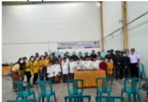
Gambar 2. Peserta setelah Penyampaian informasi