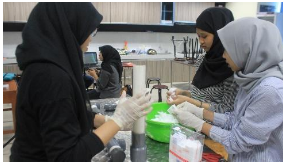
Gambar 2. Dokumentasi Pelaksanaan kegiatan secara online dan offline Rangkaian kegiatan dimulai pada tanggal

Adapun bentuk fasilitas yang disediakan dalam kegiatan workshop yang disediakan oleh tim pengabdian masyarakat Fakultas Ilmu Keolahragaan Jurusan Ilmu Kesehatan Masyarakat Universitas Negeri Malang berupa pemateri dari Badan Riset dan Inovasi Daerah (BRIDA) Kota Bima yang menyampaikan materi dengan topik baku mutu air dan bagaimana Teknik sampling air, alat – alat yang digunakan untuk praktik pengukuran kualitas udara, kebisingan, cahaya, pengukuran kualitas air, ovitrap, flygrill, E-modul panduan pengukuran, doorprize, serta sertifikat kompetensi.