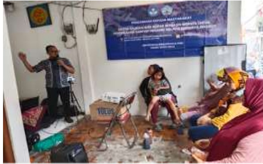
Gambar 4. Penyuluhan sistem informasi Maggot

Hasil budidaya maggot dapat dijual melalui web aplikasi. Penjual dapat menawarkan hasil maggot melalui aplikasi. Nilai jual ini dapat menambah penghasilan bagi warga. Para warga menggunakan sampah organik dari rumah tangga, sebagai proses pengolahan sampah organik. Proses pengolahan sampah organik dapat mengurangi sampah, sehingga beban tempat pembuangan sampah dapat berkurang. Seperti diketahui sampah yang berasal dari DKI dibuang ke tempat pembuangan akhir Bantar Gebang kota Bekasi Jawa-Barat.