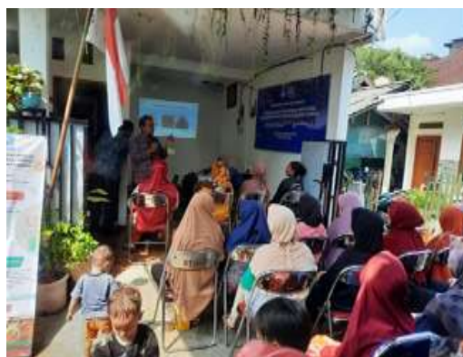
Gambar 3. Penyuluhan Nilai Ekonomis Maggot

Nampak pada gambar 2, anggota tim, pengabdian kepada masyarakat, memberikan contoh kepada peserta, dalam pemberian nasi kepada Maggot. Pemberian makanan kepada maggot sebaiknya secara bertahap. Makanan dapat bervariasi, mulai dari sayuran atau makanan yang sudah tidak terpakai (kadaluarsa). Setelah maggot diletakkan dalam media makan, selanjutnya wadah ditutup dengan kain hitam agar serangga seperti semut dan lalat hijau tidak masuk ke dalam bak sampah berisi maggot. Tomberlin (2009) memaparkan banyak faktor yang mempengaruhi keberhasilan budidaya maggot. Hal yang mempengaruhi produksi maggot yaitu kondisi lingkungan dan kandungan nutrient bahan pakan. Bahan yang cocok bagi pertumbuhan maggot adalah bahan yang banyak kandungan bahan organik serta memiliki kondisi yang lembab.