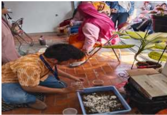
Gambar 2. Pemberian makanan kepada Maggot

Maggot dapat hidup dengan baik jika makanan yang diberikan tepat waktu. Pemberian makanan maggot berupa sampah organik, seperti sayur-sayuran, nasi dan semua makanan yang sudah memasuki pembusukan. Pemberian makanan maggot dapat dilihat pada gambar 2 dibawah ini.