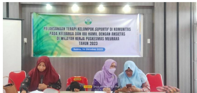
Gambar 2. Pelaksanaan kegiatan

Lokasi kegiatan dapat ditelusuri menggunakan link sebagai berikut: https://www.google.com/maps/place/5%C2%B033'45.4%22N+95%C2%B018'02.7%22E/@5.5628691,95.3008186,123m/data=!3m1!1e3!4m4!3m3!8m2!3d5.562613!4d95.3007507!5m2!1e2!1e4?hl=id&entry=ttu