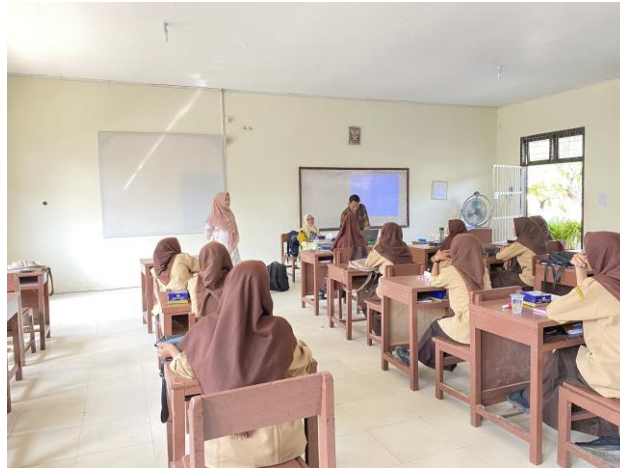
Gambar 2. Penguatan wawasan kebangsaan terhadap siswa SMKN 1 Langsa

total siswa yang menjadi sasaran kegiatan adalah 150 siswa. Pada tahap awal, tim PKM melakukan tahap pengenalan dengan siswa, kemudian pretes berupa sesi tanya jawab tentang wawasan kebangsaan kepada siswa, kemudian dilanjutkan oleh penjelasan tentang program kegiatan PKM yang akan dilaksanakan, pemutaran video animasi terkait sikap intoleransi dan radikalisme, kemudian sesi penguatan tentang wawasan kebangsaan yang harus dimiliki oleh siswa sebagai dasar pencegahan atas tindakan intoleransi dan radikalisme.