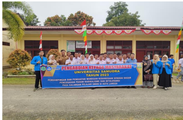
Gambar 5. Foto bersama dengan guru dan siswa SMK 2 yang telah diberikan penguatan wawasan kebangsaan.

Tim PKM juga menjelaskan tentang kehebatan pemuda-pemuda bangsa, pahlawan-pahlawan cerdas yang berasal dari Indonesia, anak-anak muda berprestasi, sebagai role model mereka agar lebih mencintai produk-produk lokal sehingga pendapatan nasional tidak dimanfaatkan oleh pihak asing.