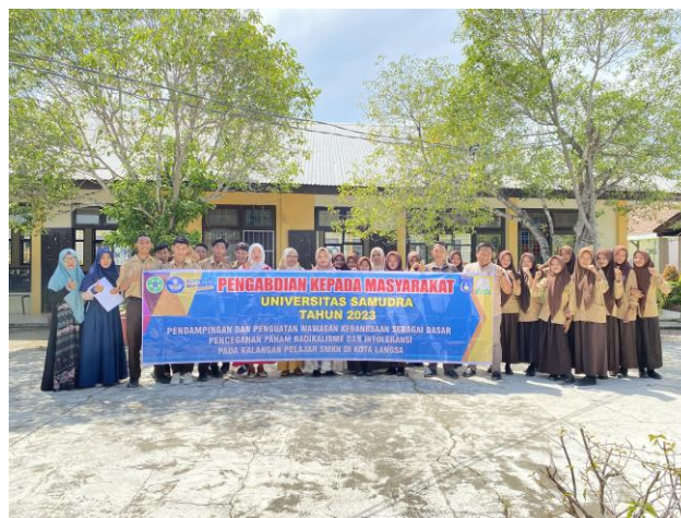
Gambar 3. Foto bersama dengan guru dan siswa SMK 1 yang telah diberikan penguatan wawasan kebangsaan.

Tim PKM kemudian menjelaskan tentang sejarah wawasan kebangsaan yang terlahir karena keinginan bersama masyarakat Indonesia yang ingin terbebaskan dari belenggu penjajah yang memecah belah persatuan dan kesatuan di Indonesia. Kesadaran dari persatuan masyarakat inilah yang kemudian terwujud menjadi gagasan, tekad, dan sikap yang berawal dari nilai-nilai kebudayaan daerah dan bangsa sehingga terwujudlah suatu wawasan kebangsaan.