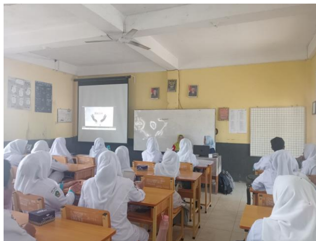
Gambar 9. Penguatan wawasan kebangsaan terhadap siswa SMKN 6 Langsa