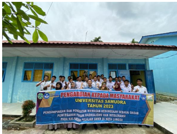
Gambar 8. Foto bersama dengan siswa SMK 4 yang telah diberikan penguatan wawasan kebangsaan.