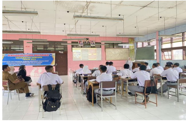
Gambar 4. Penguatan wawasan kebangsaan terhadap siswa SMKN 2 Langsa

Tim PKM juga menjelaskan tentang kehebatan pemuda-pemuda bangsa, pahlawan-pahlawan cerdas yang berasal dari Indonesia, anak-anak muda berprestasi, sebagai role model mereka agar lebih mencintai produk-produk lokal sehingga pendapatan nasional tidak dimanfaatkan oleh pihak asing.