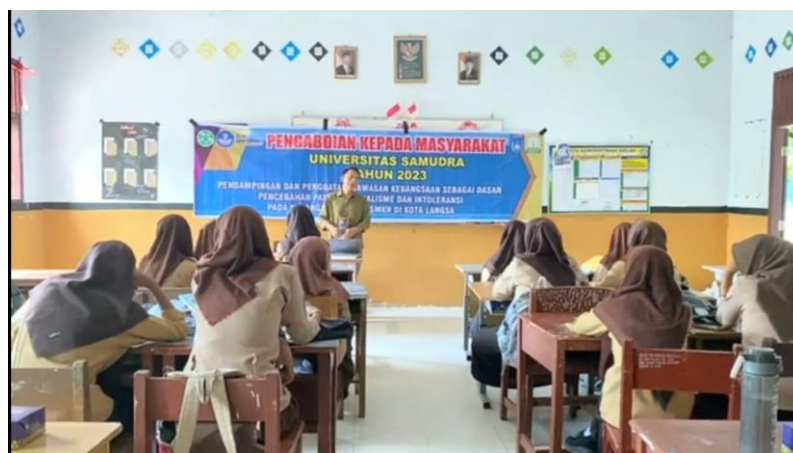
Gambar 6. Penguatan wawasan kebangsaan terhadap siswa SMKN 3 Langsa

Selanjutnya, Tim PKM menjelaskan kepada siswa tentang makna dari wawasan kebangsaan yaitu tentang pentingnya persatuan dan kesatuan bangsa dalam mempertahankan keutuhan bangsa, termasuk di zaman modern ini dimana perang bisa dilakukan melalui perusakan ideologi ataupun perang ekonomi. Selanjutnya makna wawasan kebangsaan adalah tentang penerapan semboyan Bhinneka Tunggal Ika yang harus diterapkan dalam kehidupan sehari-hari, tidak boleh mendiskriminasi teman dan tidak boleh melakukan perundungan terhadap teman. Tidak boleh berlaku rasis kepada teman agar tidak terjadi intoleransi, dan sebagainya.