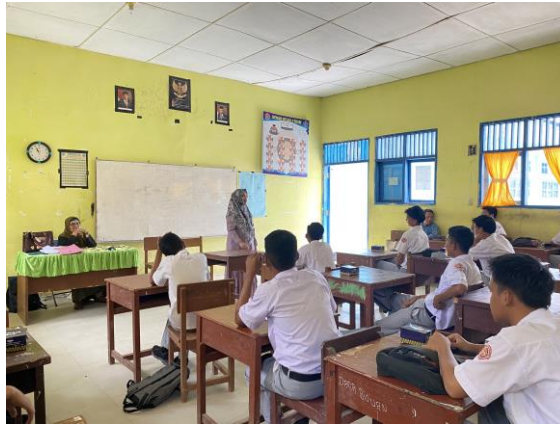
Gambar 7. Penguatan wawasan kebangsaan terhadap siswa SMKN 4 Langsa

Terakhir, Tim PKM menjelaskan pentingnya wawasan kebangsaan yaitu munculnya rasa bangga sebagai bangsa Indonesia, kemudian dapat menangkal segala pengaruh negatif yang dapat memecah belah persatuan dan kesatuan bangsa serta memicu perilaku intoleransi dan radikalisme. Kemudian, tim PKM melakukan pretest kepada seluruh peserta siswa SMK 1,2,3,4,5, dan 6 berupa sesi tanya jawab singkat tentang wawasan kebangsaan dan terdapat perubahan pemahaman yang mereka dapatkan dilihat dari jawaban siswa yang membaik setelah mendapatkan penguatan tentang wawasan kebangsaan.