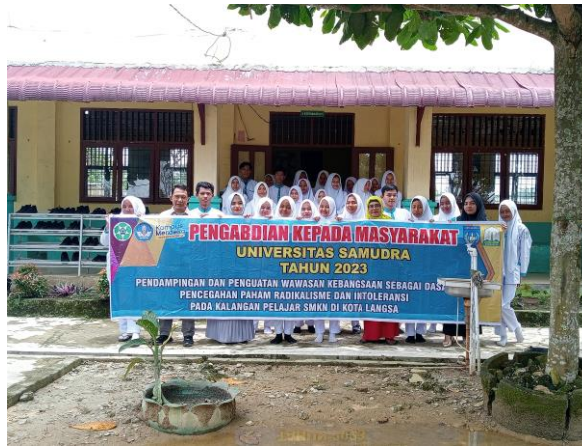
Gambar 10. Foto bersama dengan siswa SMK 4 yang telah diberikan penguatan wawasan kebangsaan