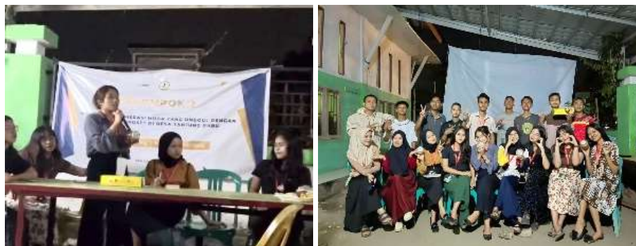
Gambar 4. Pengenalan produk kepada masyarakat