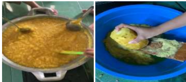
Gambar 2. Proses pengolahan buah nanas menjadi selai