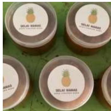
Gambar 3. Proses pengemasan sela nanas