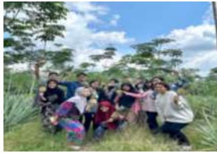
Gambar 1. Mengunjungi kebun nanas dan panen nanas