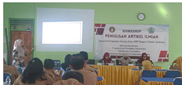
Gambar 3. Pelaksanaan PKM Materi Ketiga

Pada pertemuan ketiga, tim pengabdian memberikan pengetahuan dan pendampingan tentang tata cara penyusunan hasil dan pembahasan yang didasarkan pada metode penelitian. Penyusunan hasil dan pembahasan tidak bisa terlepas dari pendahuluan dan metode penelitian yang telah disusun pada pertemuan sebelumnya. Kemudian pada pertemuan keempat, tim pengabdian memberikan pendampingan tentang cara membuat kesimpulan berdasarkan hasil dan pembahasan yang telah disusun sebelumnya. Tim pengabdian juga memberikan pendampingan tentang cara membuat daftar rujukan dengan menggunakan aplikasi Mendeley. Selanjutnya pada hari terakhir, tim pengabdian membimbing para peserta agar mampu mensubmit artikelnya ke jurnal ber-ISSN agar dapat dipublikasikan.