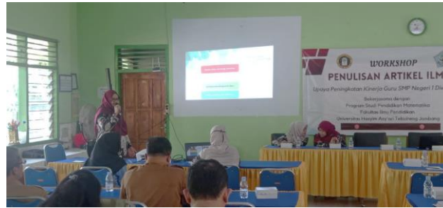
Gambar 4. Pelaksanaan PKM Materi Keempat

Hasil pengisian angket (Gambar 5) digunakan sebagai umpan balik dan juga evaluasi bagi tim pengabdian untuk pelaksanaan pengabdian berikutnya. Dari hasil pengisian angket diketahui bahwa para peserta sangat antusias sekali mengikuti workshop ini. Bahkan banyak peserta yang ingin waktunya ditambah. Dari 38 peserta memberikan umpan balik yang sangat bagus dari pelaksanaan workshop ini. Adapun persentase perhitungannya adalah sebagai berikut: