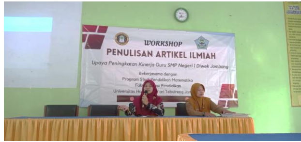
Gambar 1. Pelaksanaan PKM Materi Pertama

Pertemuan kedua, tim pengabdian menyampaikan materi tentang tata cara menyusun metode penelitian dalam artikel ilmiah. Dalam menyampaikan materi metode penelitian memuat tentang penelitian kuantitatif, kualitatif, eksperimen, dan non eksperimen (Siswono, 2019). Peserta workshop dapat memilih jenis penelitian yang akan digunakan sesuai dengan permasalahan yang dihadapi di lapangan.