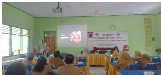
Gambar 2. Pelaksanaan PKM Materi Kedua

Pertemuan kedua, tim pengabdian menyampaikan materi tentang tata cara menyusun metode penelitian dalam artikel ilmiah. Dalam menyampaikan materi metode penelitian memuat tentang penelitian kuantitatif, kualitatif, eksperimen, dan non eksperimen (Siswono, 2019). Peserta workshop dapat memilih jenis penelitian yang akan digunakan sesuai dengan permasalahan yang dihadapi di lapangan.