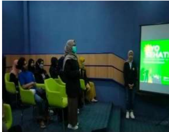
Gambar 3. Salah satu peserta penanya dari Bank Syariah

Setelah penyampaian materi yang disampaikan oleh para narasumber, sesi berikutnya yaitu tanya jawab. Kami memberikan kesempatan kepada para peserta untuk bertanya mengenai materi yang telah diberikan. Terdapat 4 penanya, yaitu 3 peserta dari Mahasiswa Fakultas Pertanian dan 1 Peserta dari perwakilan Bank Syariah.