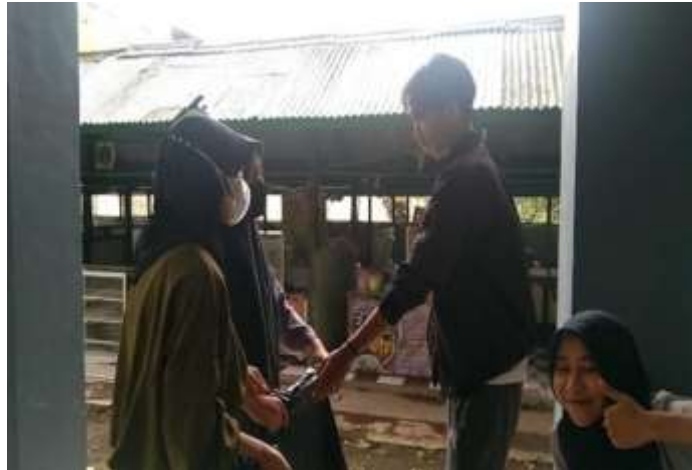
Gambar 5. Pengumpulan sampah oleh panitia organic 2022