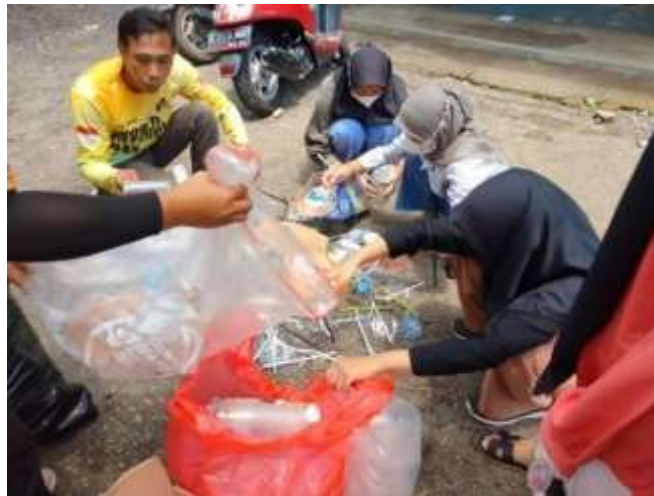
Gambar 6. Penimbangan Sampah Plastik

Penimbangan dan pengangkutan sampah dilakukan oleh pihak BSI (Bank Sampah Induk) cabang Jember yang dimana dalam hal ini diwakili oleh seorang bapak dan ibu serta dibantu oleh mahasiswa Fakultas Pertanian khususnya adalah Panitia proyek sosial yaitu Kelompok 4 Pendidikan Pancasila Kelas 11. Penimbangan dan pengangkutan sampah ini dilaksanakan pada hari Minggu, 20 November 2022 kisaran pukul 10.15 WIB – 11.00 WIB. Penimbangan dan penjemputan sampah ini tidak hanya dilakukan sekali tetapi pada tanggal 28 November juga melakukan penimbangan dan pengangkutan sampah yang kedua kali.