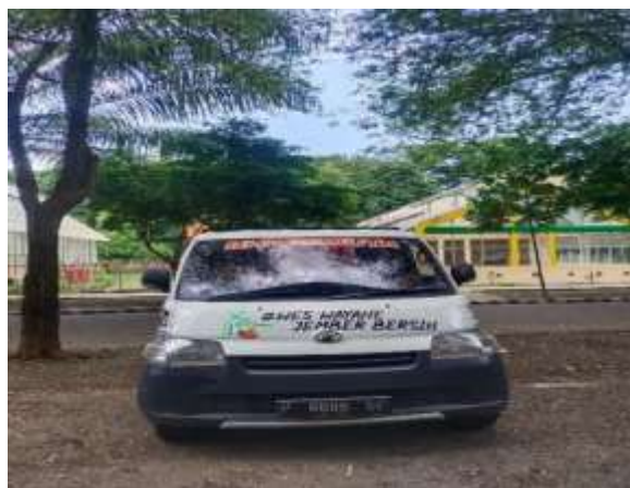
Gambar 7. Penimbangan dan Pengangkutan Sampah yang kedua