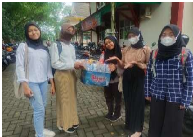
Gambar 4. Pengumpulan limbah plastik oleh Mahasiswa Fakultas Pertanian

Penyampaian informasi terkait pengumpulan limbah plastik ditujukan kepada mahasiswa Fakultas Pertanian Universitas Jember khususnya kepada Panitia Inaugurasi Pasca Organic 2022 dan mahasiswa baru, Mahasiswa Fakultas Pertanian sangat antusias dan berperan aktif dalam kegiatan pengumpulan sampah plastik. Sampah yang terkumpul, kami tampung terlebih dahulu menunggu pengumpulan selanjutnya agar lebih banyak dan dapat langsung dilakukan penimbangan.