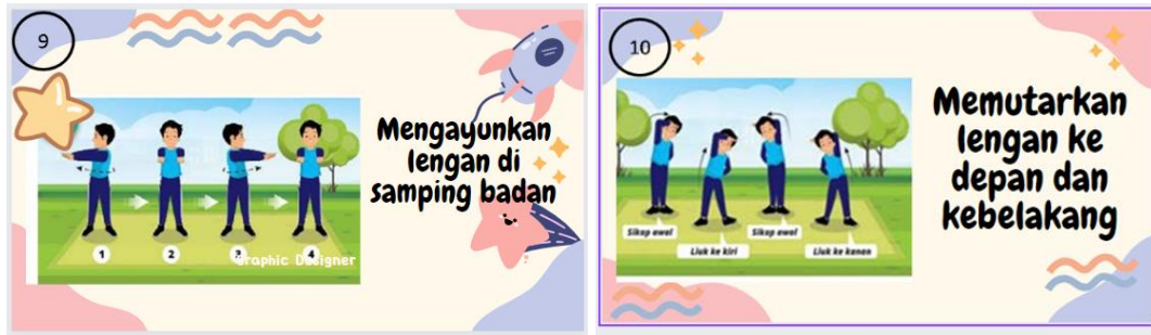
Gambar 6. Contoh Kartu Kreatif Gerakan 9 dan Contoh Kartu Kreatif Gerakan 10