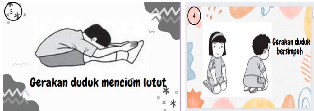
Gambar 3. Contoh Kartu Kreatif Gerakan 3 dan Contoh Kartu Kreatif Gerakan