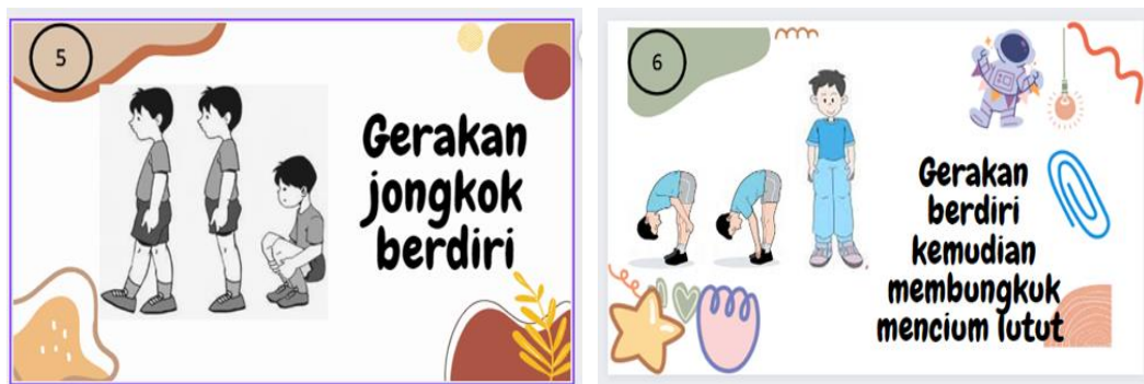
Gambar 4. Contoh Kartu Kreatif Gerakan 5 dan Contoh Kartu Kreatif Gerakan 6