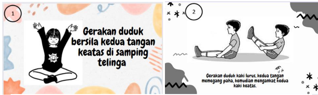
Gambar 2. Contoh Kartu Kreatif Gerakan 1 dan Contoh Kartu Kreatif Gerakan 2

dalam proses pembelajaran untuk meningkatkan aktivitas gerak dalam pemebelajaran pengembangan fisik motorik anak usia dini. Permainan kartu kreatif sebagai media belajar pada anak usia dini sangat membantu pada proses pembelajaran aktivitas gerak pada anak usia dini di PAUD Matahari.