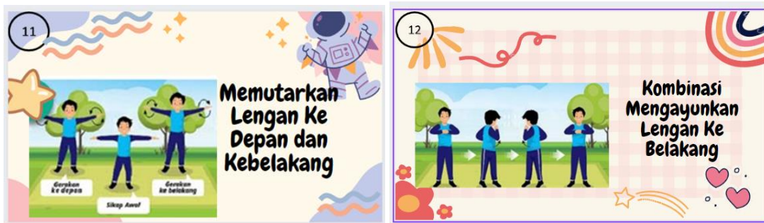
Gambar 7. Contoh Kartu Kreatif Gerakan 11 dan Contoh Kartu Kreatif Gerakan 12