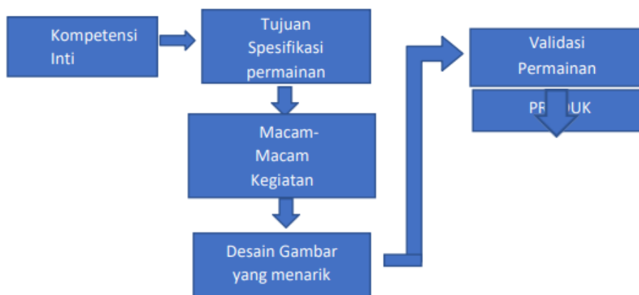
Gambar 1. Diagram alur langkah pembuatan kartu kreatif