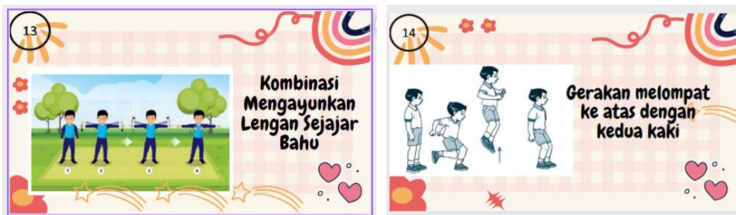
Gambar 8. Contoh Kartu Kreatif Gerakan 13 Contoh Kartu Kreatif Gerakan 14