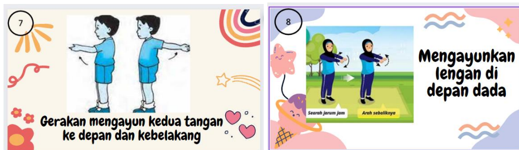
Gambar 5. Contoh Kartu Kreatif Gerakan 7 dan Contoh Kartu Kreatif Gerakan 8