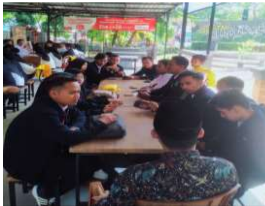
Gambar 2. Penyusunan Proker dan Diskusi bersama DPL

Sesuai dengan metode pelaksanaan kegiatan KKM, hal pertama dilakukan yakni melaksanakan survei, survei dilaksanakan di Kantor Desa Ngampungan yang melibatkan Kepala Desa Ngampungan beserta Sekretaris Desa Ngampungan. Hasil dari kegiatan ini ditemukan beberapa keluhan yang menjadi perhatian khusus untuk segera di tindak lanjuti. Adapun keluhan tersebut mengenai kurang optimalnya digitalisasi pada Desa Ngampungan.