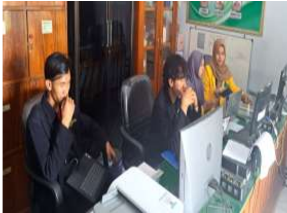
Gambar 3. Rancang bangun website dan optimasi program

mempelajarinya dengan mudah agar nantinya website tersebut dapat dikelola dan dikembangkan lebih baik lagi. Rancang bangun website dapat dilihat pada Gambar 3