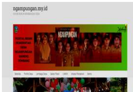
Gambar 4. Realisasi Website Desa Ngampungan

Setelah langkah pembuatan website selesai, maka hal tersebut berarti realisasi program kerja sudah terlaksana.