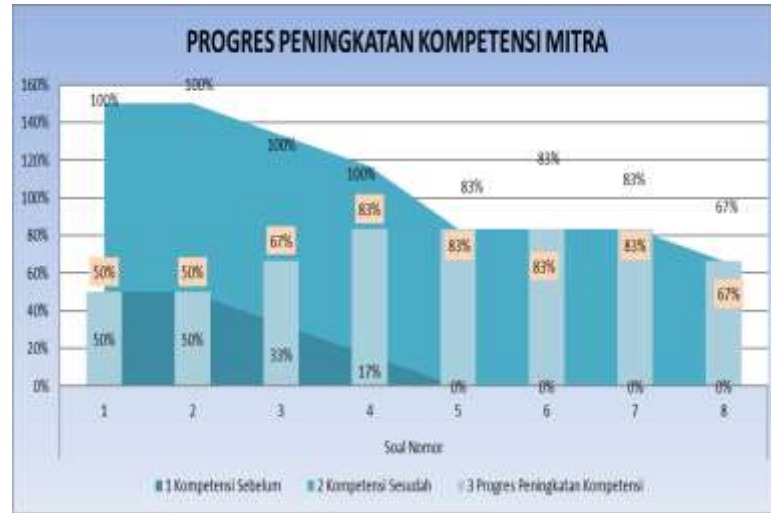
Gambar 2. Grafik Progres Peningkatan Keberdayaan

Berdasarkan hasil evaluasi dari pre-test dan post-test diatas, maka melalui kegiatan pengabdian masyarakat ini berhasil meningkatkan tingkat keberdayaan peserta dengan rata-rata 71% terutama dalam membuat dan editing video pembelajaran menggunakan apliaksi Apoweredit.