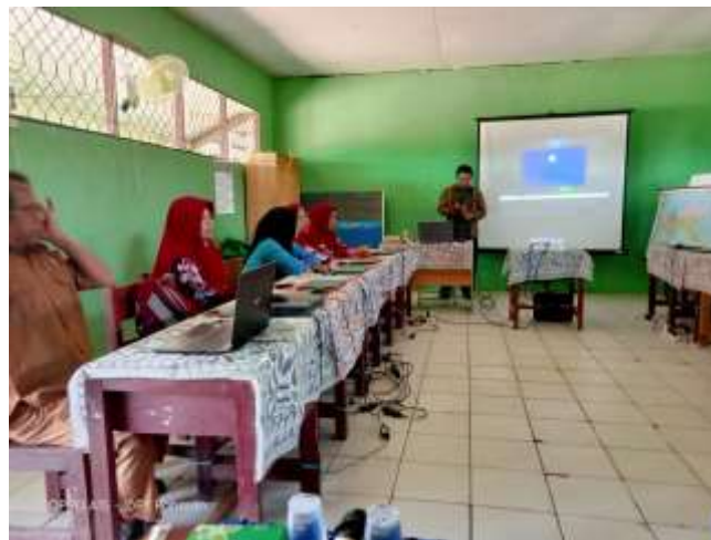
Gambar 3. Sambutan Kepala Sekolah

Berdasarkan hasil evaluasi dari pre-test dan post-test diatas, maka melalui kegiatan pengabdian masyarakat ini berhasil meningkatkan tingkat keberdayaan peserta dengan rata-rata 71% terutama dalam membuat dan editing video pembelajaran menggunakan apliaksi Apoweredit.