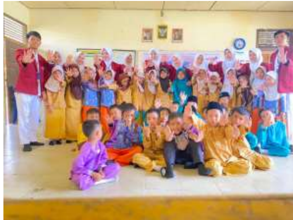
Gambar 3. Foto Bersama dengan Siswa-siswi SDN 004 Makmur Sejahtera

kebersihan. Pihak sekolah sangat antusias dan mendukung kegiatan ini dengan memberikan izin dan menjadi mitra Kerjasama dalam kegiatan ini dan tim juga dibantu oleh beberapa mahasiswa kesehatan masyarakat. Kegiatan pengabdian ini berjalan dengan lancar, hal ini terlihat dari siswa-siswi sangat senang dan semangatnya siswa-siswi dalam mendengarkan penyuluhan dan banyaknya siswa-siswi yang mengajukan pertanyaan saat dilakukan sosialisasi, serta siswa-siswi mengikuti kegiatan pengabdian masyarakat ini sampai selesai.