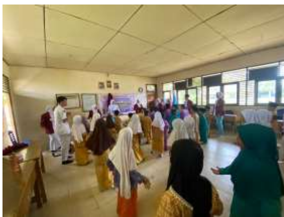
Gambar 2. Penyampaian Materi dan games

Kegiatan Perilaku hidup bersih dan sehat (PHBS) di sekolah dapat berjalan dengan lancar perlu Kerjasama antara pihak sekolah, orang tua maupun dari puskesmas setempat. Pihak sekolah dalam mendukung terselenggaranya kegiatan sanitasi yang baik dapat menyediakan sarana dan prasarana untuk menunjang kelancaran proses belajar mengajar yang efektif dan efisien. Tanpa dukungan sarana dan prasara yang memadai akan sulit mewujudkan sanitasi dan perilaku hidup bersih dan sehat yang baik. Hal ini sesuai dengan kegiatan yang dilakukan di salah satu sekolah dasar juga yang menyatakan bahwa dengan pemberian sarana dan prasana tempat sampah organik dan anorganik dapat melatih dan membiasakan siswa siswi memisahkan sampah berdasarkan jenisnya (Kusumaningtiar dkk., 2019).