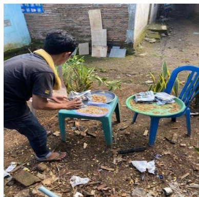
Gambar 8. Proses penjemuran adonan

Setelah adonan berubah warna menjadi kecoklatan dan kemudian adonan siap dipotong menjadi tipis – tipis dan selanjutnya proses pengeringan adonan dilakukan dengan metode menjemur dibawah sinar matahari selama 3 (tiga) hari.