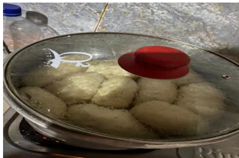
Gambar 6. Pengukusan adonan keripik

Setelah adonan telah terbentuk maka langkah berikutnya adalah menyiapkan wajan khusus pengukusan untuk adonan keripik telah siap kemudian dimasak dengan metode di kukus dengan rentan waktu selama tiga (3) jam lamanya dengan api kecil hingga adonan keripik berubah warna menjadi coklat.