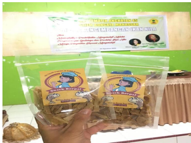
Gambar 9. Kemasan keripik ikan nila Desa Borong Pa'la'la

Proses penjemuran adonan selama tiga (3) hari dengan tujuan agar adonan mendapatkan tekstur yang keras karena jika adonan lembek (tidak kering) maka pada saat di goreng keripik ikan nila akan gagal mengembang dan menjadi kerupuk itu sebabnya dibutuhkan waktu selama tiga (3) hari untuk menjemur adonan keripik agar bisa betul – betul mengering dengan sempurna. Jika adonan tadi telah selesai dijemur maka proses selanjutnya adalah menggoreng adonan yang dijemur tadi untuk menjadi keripik dengan menggunakan minyak goreng dan api yang sedang.