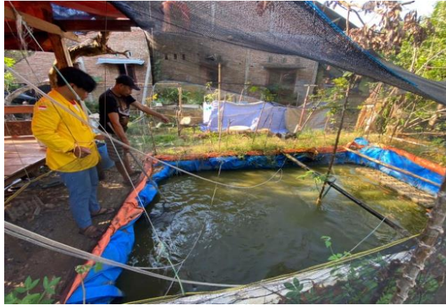
Gambar 1. Observasi tambak ikan nila milik warga desa