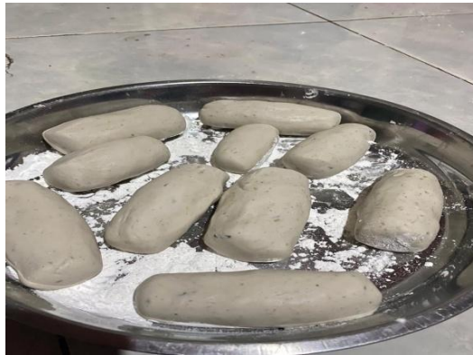
Gambar 5. Adonan yang sudah diaduk dan dibentuk

Adonan yang telah diaduk secara merata kemudian dilakukan pembentukan dengan membuat adonan menjadi bentuk persegi panjang. Hal ini bertujuan agar adonan nantiya jauh lebih mudah untuk dipotong - potong menjadi keripik dan proses pembentukan ini memakan waktu kurang dari dua puluh (20) menit.