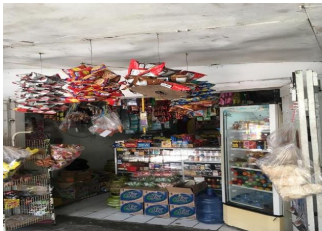
Gambar 11. Warung konvensional tempat penitipan keripik

Pada tahapan akhir dilakukan percobaan pemasaran, saat memasarkan produk PkM ini menggunakan metode jasa titip pada kios/warung konvensional dengan menitipkan 10 buah produk di setiap warungnya yang berada di wilayah desa maupun di kota makassar. hal ini tentunya lumayan provit dari segi penjualan akan tetapi kurangnya komunikasi yang dibangun oleh para pemilik kios/warung dalam hal untuk me-Restock kembali produk membuat kami sedikit mengalami kerugian dalam hal produksi massive sehingga akhirnya kami memutuskan berhenti memasarkan produk pada kios/warung.