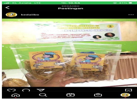
Gambar 12. Penjualan produk menggunakan media sosial

Namun sebelumnya masyarakat berkeinginan menjual produk keripik daging ikan nila di bagian desa dan sekitarnya saja, yang berarti pemasarannya terbatas. Belum mengenal berbagai strategi pemasaran dalam memasarkan produk keripik ikan nila ke pasar yang lebih luas. Disini dijabarkan sasaran pemasaran bisa menjangkau masyarakat diluar desa bahkan bisa sampai keluar Kabupaten Gowa dengan pemasaran menggunakan media sosial seperti Facebook, Instagram, Shopee dan Market place online dan sejenisnya. Seperti yang terlihat pada gambar dibawah ini: