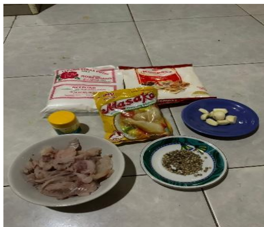
Gambar 3. Bahan-bahan yang digunakan

Gambar 2 menunjukkan daging ikan yang telah selesai dipisahkan dari tulangnya kemudian sementara menunggu daging ikan yang sedang dihaluskan, peserta mempersiapkan bumbu dan bahan-bahan lainnya yang akan dihaluskan dengan menggunakan alat seperti blender atau alat penghalus lainnya.