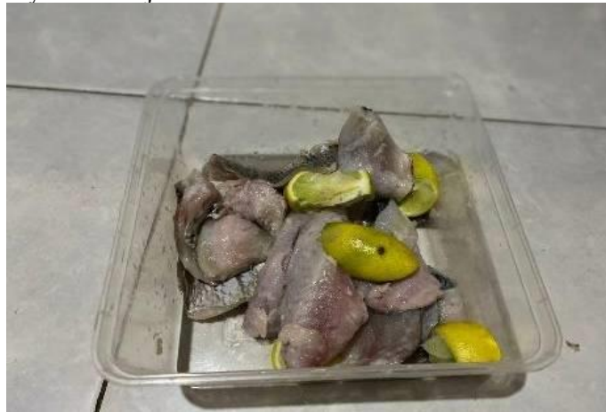
Gambar 2. Pemisahan kulit dan daging ikan nila

Langkah selanjutnya yaitu tahapan pembuatan keripik daging ikan nila. setelah mempelajari beberapa cara pembuatan keripik di media sosial, maka kami mempercepat proses pembuatan suatu produk khas desa. Dengan adanya pengolahan produk ini bisa menjadi awal yang baik untuk lebih banyak lagi pemanfaatan dan pengembangan ikan nila di desa. Harapan dengan adanya pengolahan produk ini kemudian bisa menjadi suatu pendapatan terbaru guna meningkatkan stabilitas ekonomi di desa. Berikut ditunjukkan proses cara pemisahan kulit dan daging ikan nila, setelah pemisahan kulit dan daging ikan nila selanjutnya ikan dihaluskan dengan menggunakan blender dan disaring untuk diambil sarinya untuk dijadikan adonan.