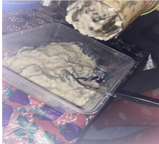
Gambar 4. Proses pengadukan daging dan bumbu

Gambar diatas menunjukkan bahwa bahan-bahan yang sudah disediakan seperti, bawang merah, bawang putih, soda kue, merica bubuk dan bahan lainnya. Setelah bumbu dan bahan-bahan yang sudah siap dihaluskan maka langkah selanjutnya yaitu pembuatan adonan keripik dengan cara mencampurkan daging ikan nila dengan bumbu yang sudah disediakan lalu campur di wadah yang telah disiapkan, setelah itu aduk sampai adonan keripik sampai merata dengan baik.