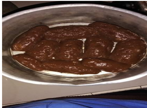
Gambar 7. Adonan keripik yang sudah masak

Selanjutnya setelah tiga (3) jam lamanya pengukusan selesai maka adonan yang telah matang didinginkan pada suhu ruangan dengan waktu tiga puluh (30) menit lamanya, ini dilakukan agar adonan tidak menjadi lembek dan bertekstur karet.