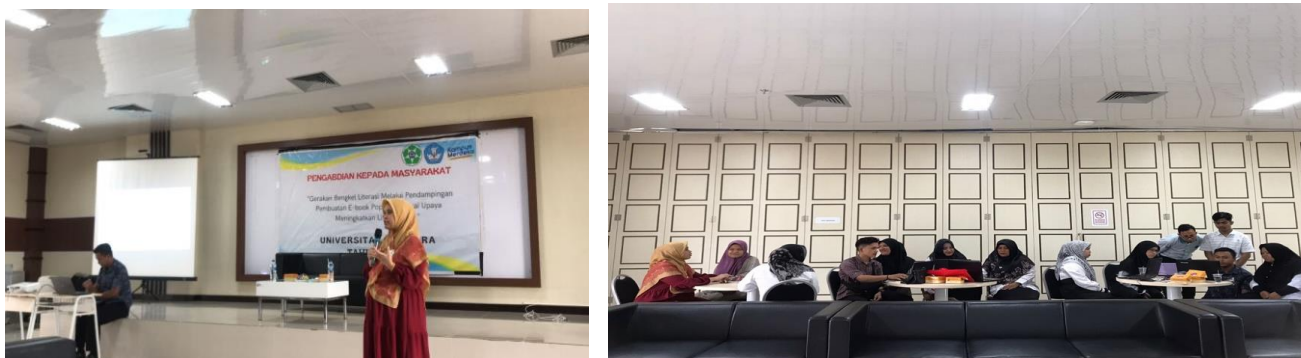
Gambar 1. Pemberian Materi pada Peserta

Masing-masing kelompok mendapatkan kesempatan dengan bebas memilih materi yang akan dalam bentuk E-PopUp. Mereka terlihat antusias dalam mencoba membuat E-PopUp. Ada beberapa peserta yang berpendapat seperti bermain sambil berpikir karena melatih daya kreativitas seseorang. Mereka menulis, menyusun, menggambar, dan menempel dengan rapi dan tenang. Saat pengisian kuesioner juga menunjukkan bahwa guru sangat senang dan terbuka dengan adanya pelatihan ini.