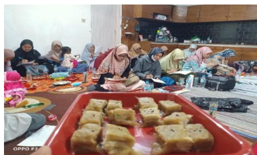
Gambar 3. Sesi Praktek

Tabel 1 menunjukkan nilai peserta dalam mengikuti pre dan post-test. Sebelum mengikuti kegiatan, tingkat pemahaman peserta cukup baik yaitu dengan nilai rata-rata 6.08 dari skala 10. Peserta dengan tingkat pemahaman terendah adalah dengan perolehan nilai 6.08 sedangkan dengan tingkat tertinggi adalah dengan nilai 8. Setelah selesai kegiatan, nilai rata-rata adalah 8.20. Ini berarti ada perubahan sebanyak 2.12. Nilai terendah dan tertinggi dari post-test yaitu 4 dan 10. Ada 5 peserta yang menjawab keseluruhan pertanyaan dengan benar. Dampak perubahan untuk masing-masing peserta juga dapat dilihat di Gambar 4. Sebagian besar peserta mengalami perubahan pemahaman lebih baik setelah mengikuti kegiatan ini. Tentunya dengan pemahaman yang lebih baik ini, maka peserta diharapkan bisa banyak menerapkan hidroponik di daerah masing-masing.