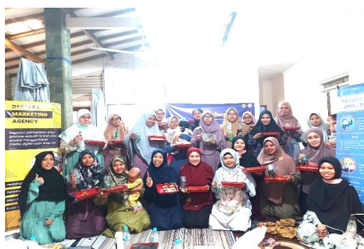
Gambar 2. Peserta Pengabdian

Pelaksanaan kegiatan dilaksanakan di kantor Yayasan Mitra Amal Mandiri di Kota Bandung dan dihadiri 25 orang peserta, sebagaimana yang ditunjukkan oleh Gambar 2 dan 3. Kegiatan tidak hanya diisi dengan sesi materi tetapi juga praktek. Sesi materi berlangsung 1 jam sedangkan praktek dilaksanakan selama 2 jam. Sebelum memulai kegiatan, peserta diminta untuk mengisi pre-test. Begitu pula setelah selesai kegiatan, peserta mengisi post-test. Hal ini bertujuan untuk mengevaluasi perkembangan pemahaman peserta sebelum dan sesudah mengikuti kegiatan.