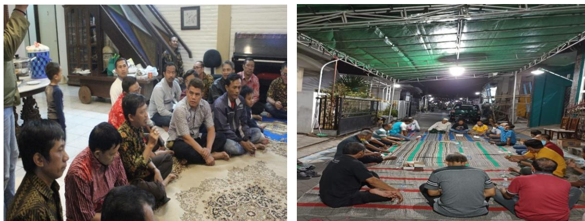
Gambar 1. Dokumentasi Kegiatan Pemilihan RW