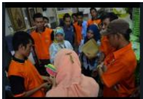
Gambar 2. Sedang melakukan diskusi dengan para warga binaan

Difusi Iptek dilakukan dengan memberikan keadaan teknologi yang digunakan di lapangan ( Field Research ) serta penjabaran yang dilakukan untuk kemudahan penyampaian informasi terkait pembuatan sandal hotel di Lapas Salemba.