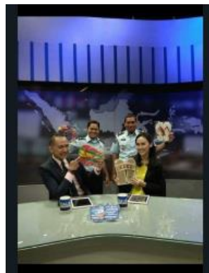
Gambar 6. Publikasi hasil produk PkM dengan Salah satu media elektronik

Semua warga binaan program ketrampilan pembuatan sandal hotel Lapas Salemba adalah para tahanan yang sedang menjalani masa hukuman.