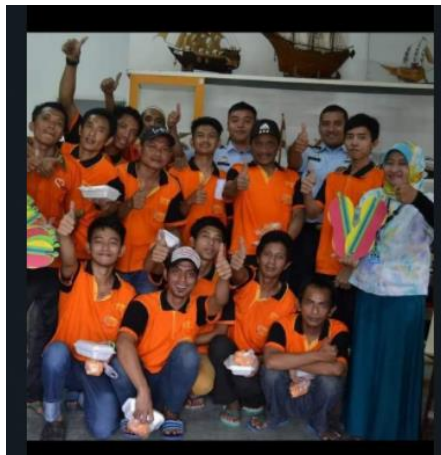
Gambar 3. Melakukan Sesi Foto bersama dengan memperlihatkan hasil produk

Gambaran dari hasil pelaksanaan pendidikan ketrampilan digunakan sebagai alat untuk mengetahui seberapa besar proses pelaksanaan program ketrampilan pembuatan sandal hotel telah memenuhi proses yang efektif dalam mencapai tujuan yang direncanakan.