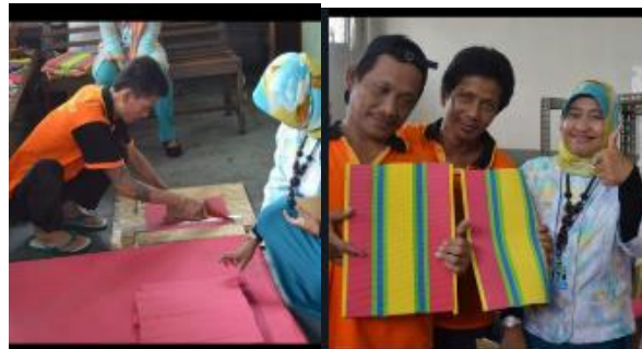
Gambar 1. Melakukan Pelatihan pembuatan Sandal Hotel dengan warga binaan

Dalam penelitian ini pendekatan yang digunakan penulis adalah deskriptif kualitatif dan deskriptif analisis. Dengan metode Pendidikan masuarakat Hal ini dilakukan dalam rangka representasi objek tentang realitas yang terdapat dalam masalah yang diteliti, untuk mendeskripsikan segala hal yang berkaitan dengan pokok masalah selanjutnya dari data yang terkumpul diproses dan dianalisis.