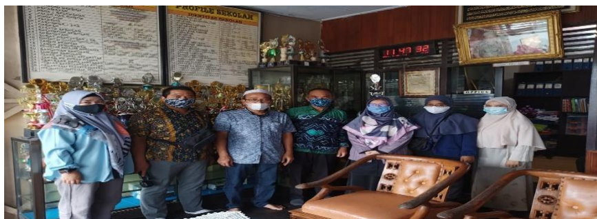
Gambar 2 Foto Kegiatan PKM