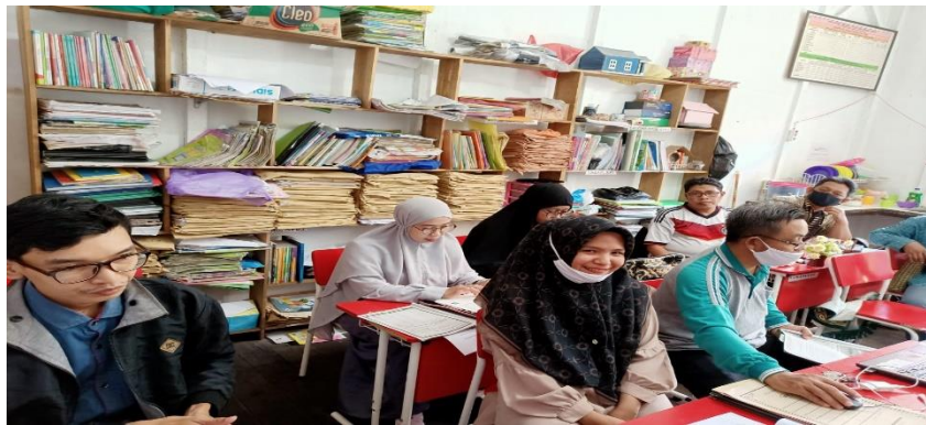
Gambar 1 Foto Kegiatan PKM