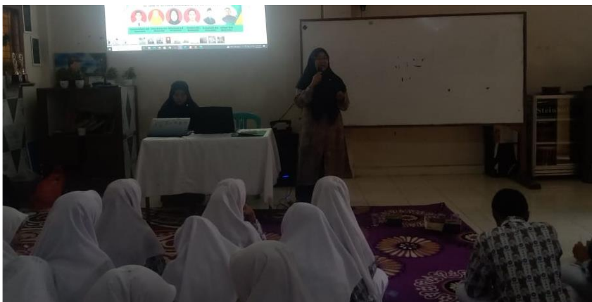
Gambar 3. Suasana pada saat sesi tanya jawab