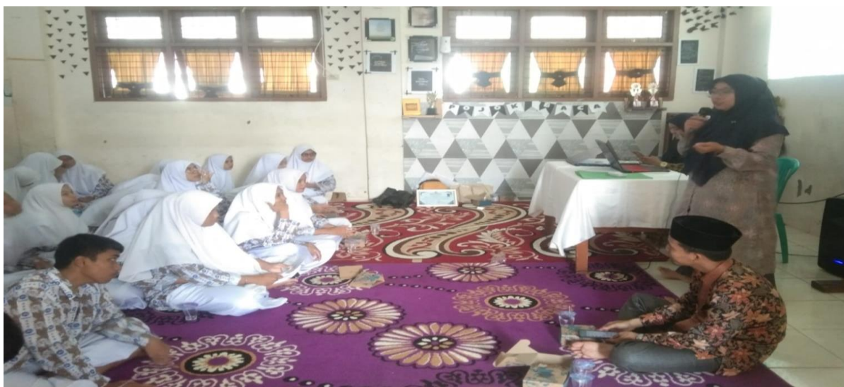
Gambar 2. Penyampaian materi oleh tim pengabdian

Materi yang disampaikan sudah sesuai dengan kebutuhan peserta dan sesuai dengan target yang sudah disusun oleh tim pengabdian, namun keterbatasan waktu yang disediakan mengakibatkan tidak semua materi tentang literasi keuangan syariah khususnya perencanaan keuangan berdasarkan prinsip syariah dapat di sampaikan kepada peserta.