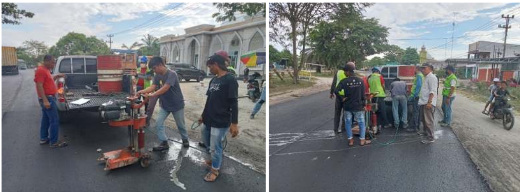
Gambar 2. Pelaksanaan Core Drill Trial Mix

Tabel di atas secara umum menunjukkan bahwa kepadatan aspal di lapangan cukup baik dan mendekati standar laboratorium. Namun, ada beberapa sampel yang memiliki kepadatan lebih rendah dari standar, terutama pada kelompok 16 nomor sampel 2, yang perlu diperhatikan lebih lanjut untuk mengidentifikasi penyebab potensial seperti kualitas material atau metode pemadatan yang tidak konsisten. Sebaliknya, beberapa sampel seperti kelompok 18 nomor sampel 1 menunjukkan pemadatan yang sangat baik, bahkan melebihi standar laboratorium.