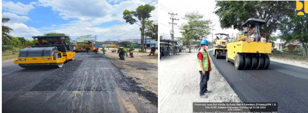
Gambar 3. Pemasangan Aspal

Hasil pengujian di atas menunjukkan variasi yang signifikan dalam stabilitas, flow , dan kepadatan bulk campuran. Data yang diperoleh menunjukkan bahwa peningkatan kadar aspal mempengaruhi nilai stabilitas dan flow , serta kepadatan bulk campuran, yang semuanya berkontribusi terhadap kualitas dan kesesuaian campuran untuk aplikasi perkerasan jalan.