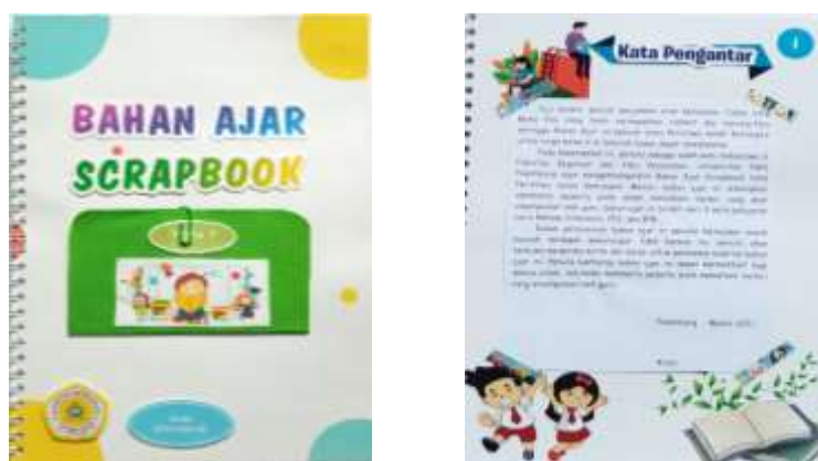
Gambar 2 Tampilan Cover Prototype I dan Kata Pengantar

Selain data-data di atas, dalam penelitian ini juga terdapat validator ahli media dan ahli materi. Dalam hal ini peneliti meminta empat validator dari latar belakang yang berbeda, yaitu ahli media, ahli materi, dan guru kelas V SDN 01 Rantau Panjang.